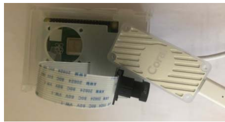
Figure 3 - Coral USB Accelerator+Rb Pi4

Coral USB Accelerator supports two different operating modes: at standard frequency and maximum frequency. At maximum frequency, output performance grows in two.