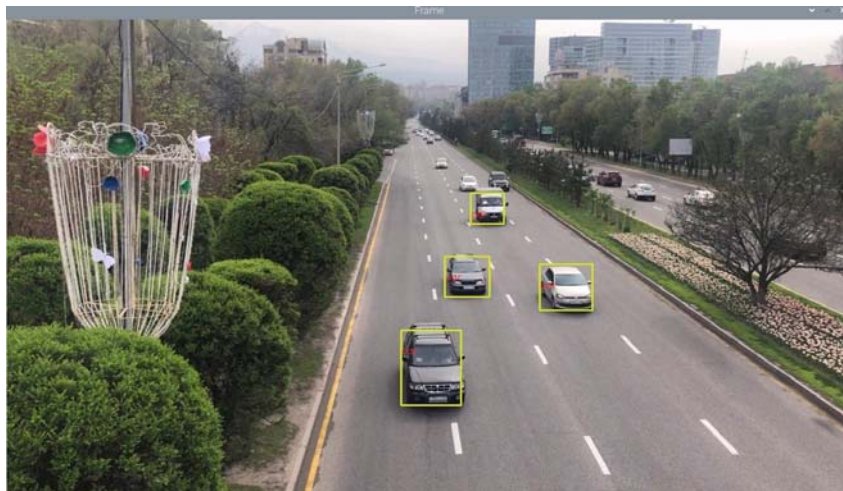
Figure 6 - Test result of MobileNet v1 / v2 SSD models in FPS (frames per second) trained using the COCO dataset

Based on the result (Figure 6), it can be seen that the detector missed small cars. The solution to this problem is to increase the resolution of input images. Vehicles that are far away are not a problem for the model. As the approach getting closer, models will be able to recognize their presence. The second problem that may encounter is that the models do not distinguish between the "front" and "frontal" type of vehicle. These incorrect classifications are partly due to the fact that the front and rear parts of vehicles have many visually similar characteristics. Despite this, MobileNet SSDs achieve high recognition accuracy.