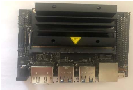
Figure 1 - NVIDIA Jetson Nano

Platform NVIDIA Jetson Nano single-board computer for computing in the field of Artificial Intelligence (AI). A small computer with CUDA-X AI library support delivers 472 gigaflops to run modern AI workloads. The solution expands the capabilities of developers in terms of creating IoT applications, including for entry-level DVRs, home robots and smart gateways with analytical capabilities.