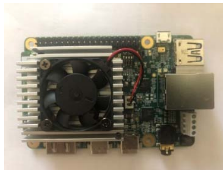
Figure 4 - Coral Dev Board

Coral Dev Board is a single-board computer that is ideal for quickly performing machine learning (ML) operations in a small form factor (technical product standard). You can use Dev Board to prototype your embedded system and then scale it to production using the integrated Coral System-on-Module (SoM) system in combination with custom PCB hardware.