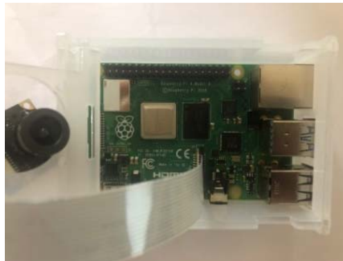
Figure 5 - Raspberry Pi 4

The Raspberry Pi 4 is a single-board computer the size of a bank card, originally developed as a budget system for teaching computer science, but later gaining wider application and fame.