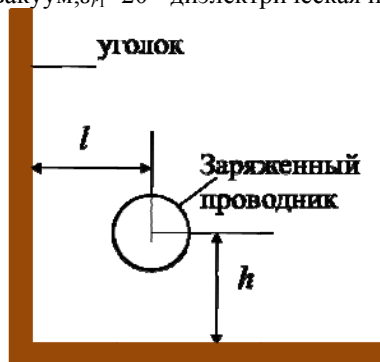
Рисунок 1 - Схема для расчета поля уголка и заряженного проводника

Электростатическое поле между диэлектрическим уголком и параллельным, длинным заряженным проводником, рисунок 1: h = l = 20 мм; d = 5 мм – диаметр проводника; \tau = 0,2 мкКл/км – линейная плотность заряда проводника; внешняя среда – вакуум; \epsilon_{r1} = 20 – диэлектрическая постоянная материала уголка.