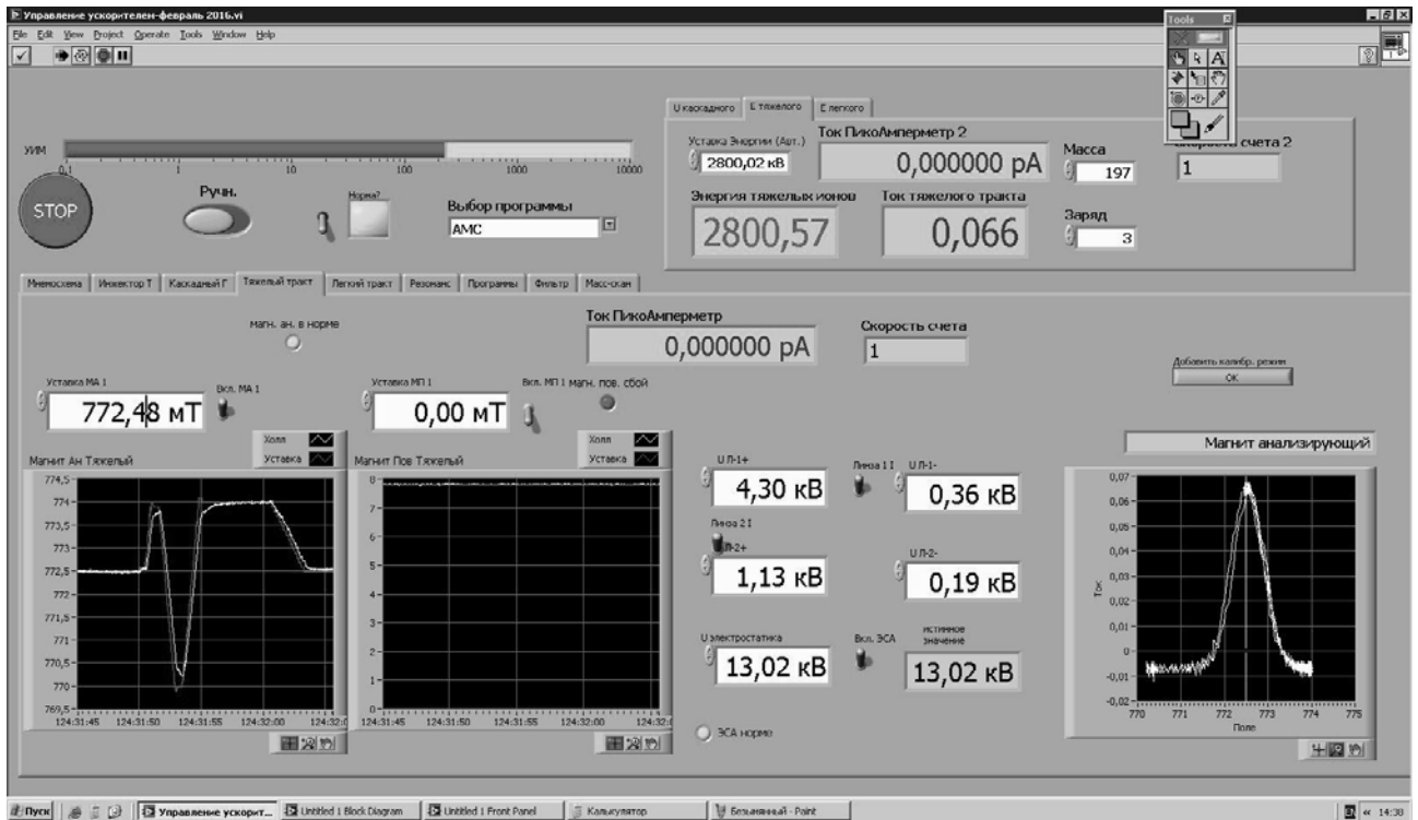
Рисунок 2 - Рабочее окно программы оператора

для каждого вида работ записываются в отдельные файлы и могут создаваться как «с нуля», так и копированием с последующей модификацией уже существующих конфигураций. Интерфейс программы разбит на два поля: одно общее для всех режимов работы, а второе выполнено в виде переключаемых закладок, которые позволяют оператору выбрать и выполнить необходимые действия с одной из подсистем (рисунок 2).